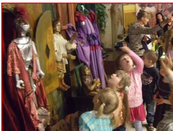
To sú nádherné bábkky