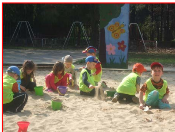
V našom pieskovisku