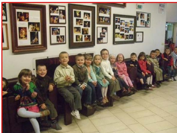
Bratislavské bábkové divadlo