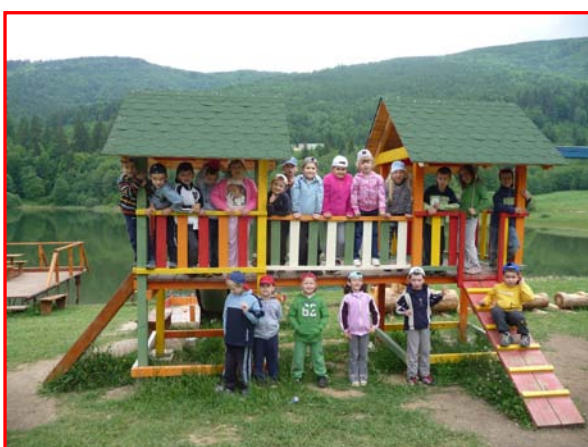
Piataci v škôlke prírode v Krpáčove